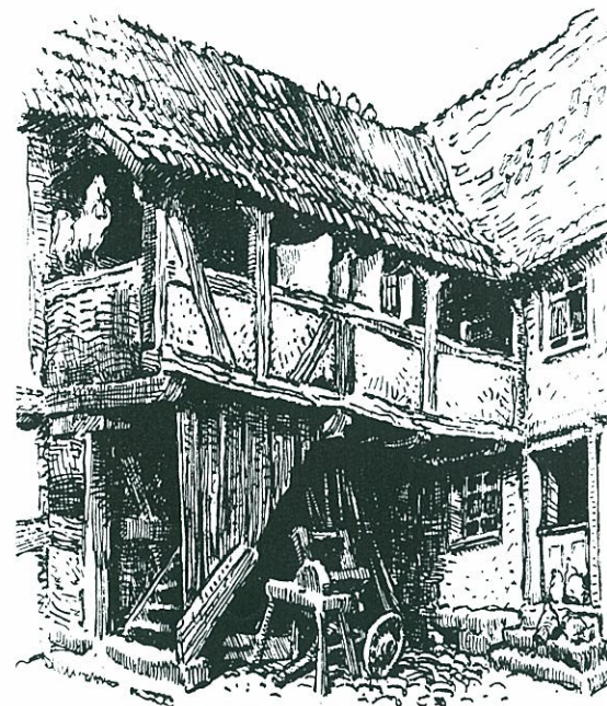
Räuber Paulus als Gockelhahn

Der Rhönpaulus hat sich in einen Hahn verwandelt!